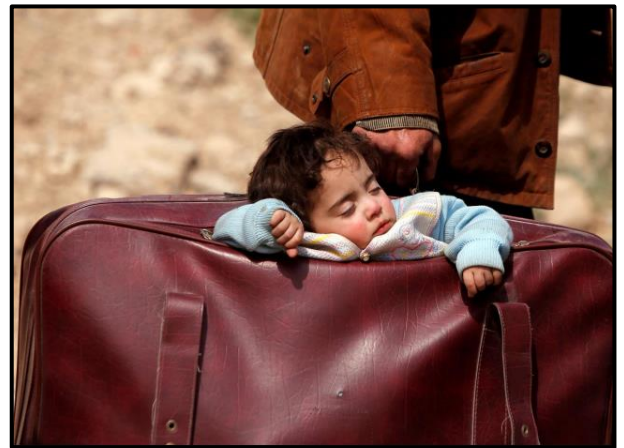
Famille de réfugiés

Fais quelques phrases pour décrire ces images. Explique ce qu'elles représentent, imagine l'histoire du jeune enfant.