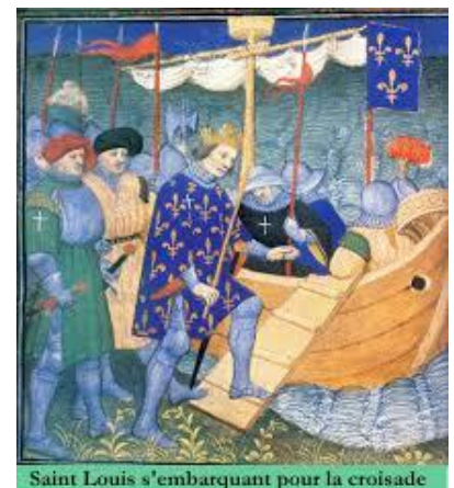
Saint Louis s'embarquant pour la croisade

Malgré cet échec, Louis IX part de nouveau en croisade en 1270. Il décide de passer par Tunis mais tombe malade et meurt sur place la même année. L'Eglise en fait un saint en 1297. C'est ainsi qu'il prend dès lors le nom de Saint-Louis.