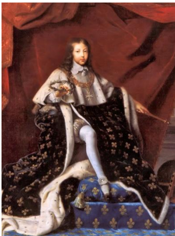
Portrait du roi enfant, 1648

Louis XIV devient roi à la mort de son père, en 1643. Il n'a que 5 ans. Etant trop jeune pour gouverner, une régence est mise en place. La France est alors dirigée par sa mère, Anne d'Autriche, conseillée par le Cardinal de Mazarin.