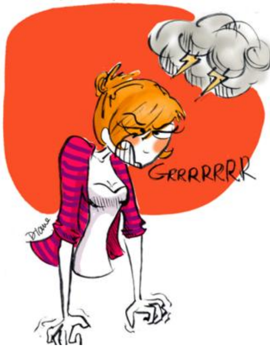
Ce qui agace tout particulièrement la maîtresse